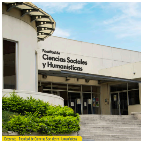
Decanato - Facultad de Ciencias Sociales y Humanísticas