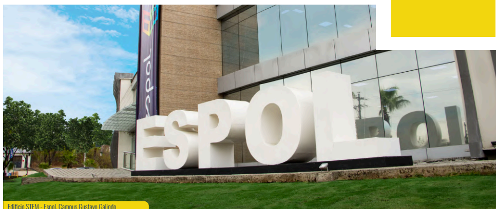
Edificio STEM - Espol, Campus Gustavo Galindo