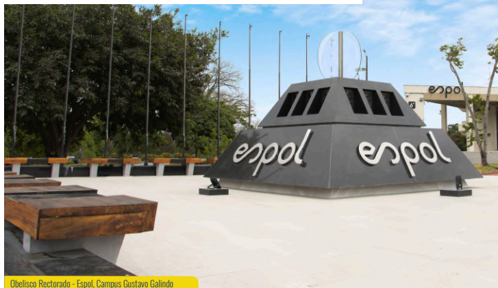
Obelisco Rectorado - Espol, Campus Gustavo Galindo