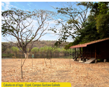
Cabaña en el lago - Espol, Campus Gustavo Galindo