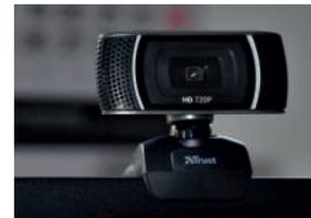
Cámaras HD 180 grados