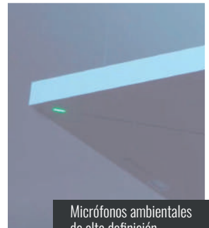
Micrófonos ambientales de alta definición

Mientras el profesor dicta sus clases desde el aula, los estudiantes tendrán la opción de elegir si asisten de forma presencial, o se conectan a través de una plataforma de videoconferencias específica.